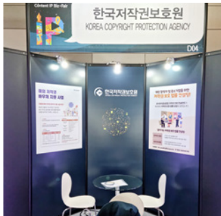
오프라인 행사 컨설팅 부스